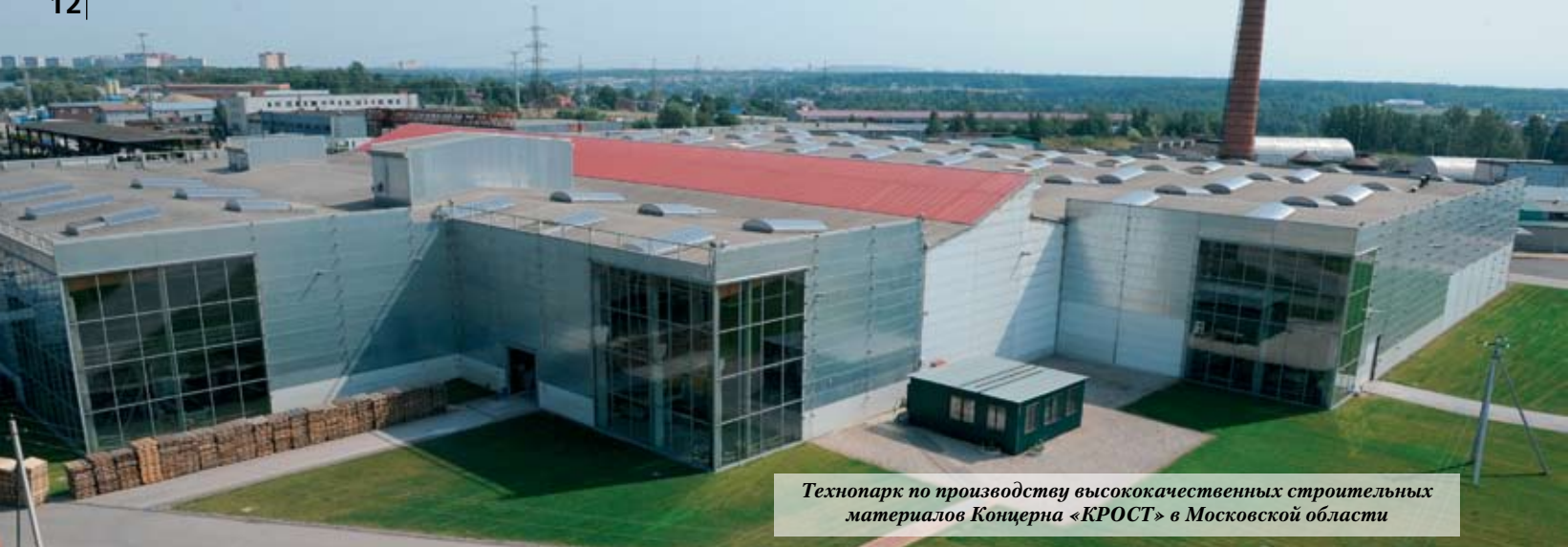
Технопарк по производству высококачественных строительных материалов Концерна «КРОСТ» в Московской области