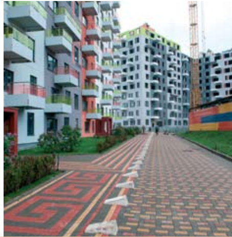
Детский сад в квартале Wellton Park. Жилой комплекс «Эдальго» в Московской области. При реализации проектов Концерн использует строительные материалы собственного производства