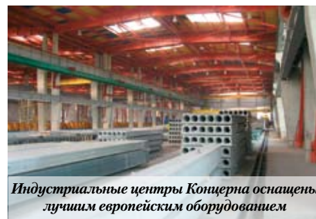
Индустриальные центры Концерна оснащены лучшим европейским оборудованием

Одна из главных особенностей предприятия – возможность изготовления уникальной продукции. Конструкторско-техническое бюро фабрики «Мажино» разрабатывает индивидуальные изделия из сборного железобетона. Для реализации уникальных объектов также привлекаются такие лидеры отрасли, как «Моспроект», «Моспроект-2», ЦНИИПРОМЗДАНИЙ, МГСУ, ЦНИИЖБ, НИИМОССТРОЙ, архитектурное бюро «НАБАД» и др.