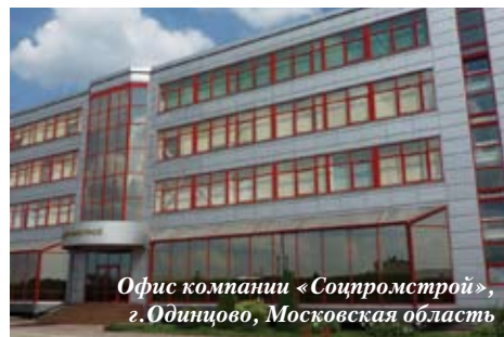
Офис компании «Соцпромстрой», г.Одинцово, Московская область

В качестве материала для изготовления системы вентилируемого фасада ОЗЛК использует оцинкованную сталь с полимерным покрытием. Изделия, изготовленные из нее, пожаробезопасны, долговечны, имеют высокую несущую способность, коррозионную стойкость, значительно меньшую по сравнению с алюминиевыми системами теплопроводность.