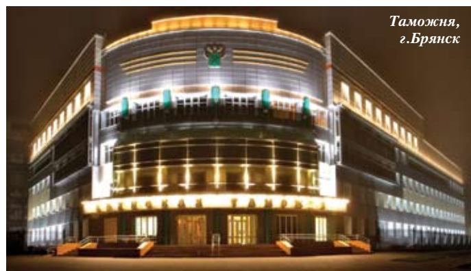
Таможня, г. Брянск

И наконец, самое главное – возможность применения СВФ ОЗЛК в строительстве подтверждена Техническим свидетельством.