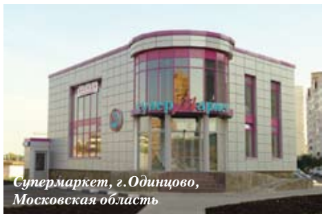
Супермаркет, г.Одинцово, Московская область