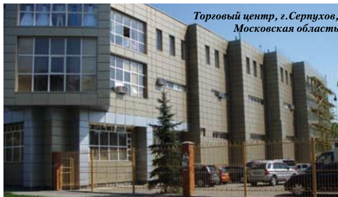
Торговый центр, г. Серпухов, Московская область