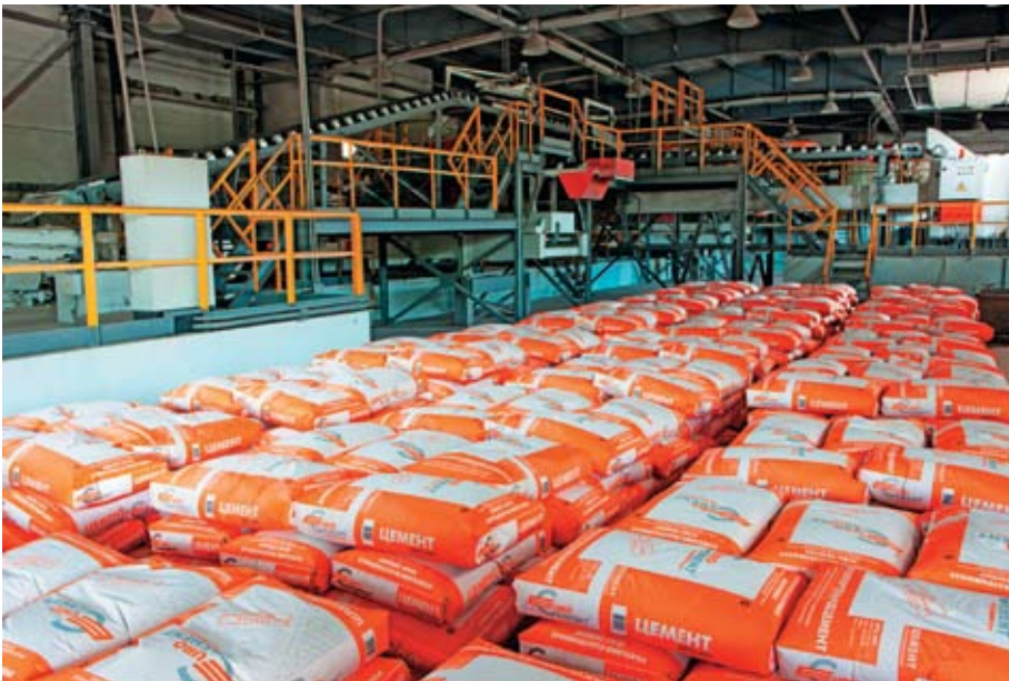
Лучший в России цемент от ЗАО «ЕВРОЦЕМЕНТ групп» в самом узнаваемом мешке – помощь потребителю