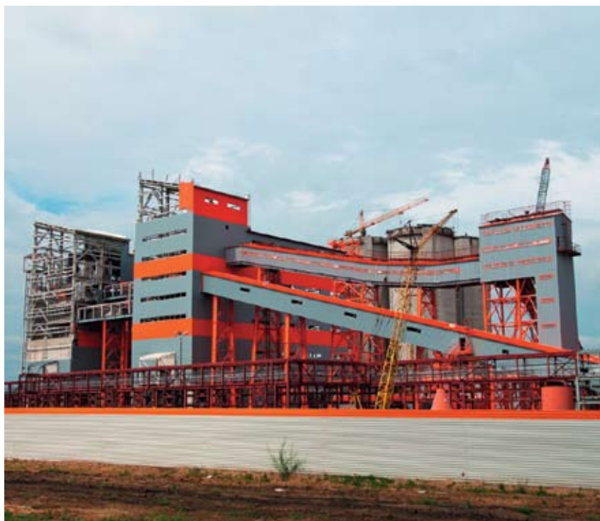
Завершается строительство инновационного завода в Воронежской области

В рамках спонсорской деятельности Холдинг «ЕВРОЦЕМЕНТ груп» участвует в создании новых культурных ценностей и традиций. Поддержка театрального фестиваля и премии «Золотая Маска», многолетнее сотрудничество с Московским международным домом музыки – примеры эффективного партнерства между крупным бизнесом и отечественной культурой. Общая сумма инвестиций Холдинга в поддержку культуры, искусства, новых творческих инициатив за последние 4 года составила более 300 млн руб.