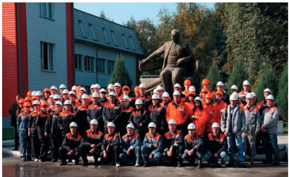
Мы — дружный коллектив

В наш век глобализации бизнес несет особую социальную и моральную ответственность. Наведение мостов взаимопонимания и сотрудничества между людьми разных вероисповеданий, национальностей в нашей стране, где проживают более 200 народов, — задача государственного значения, которую сегодня успешно решает Холдинг