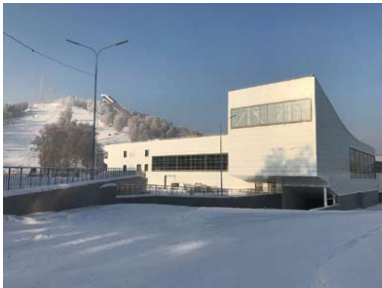
Рис. 6. Многофункциональный спортивный комплекс «Сопка»

Сегодня Красноярский край готовится к двум масштабным мероприятиям – это зимняя Универсиада 2019 года и 400-летие города Енисейска. Организационным комитетом по подготовке и проведению зимней Универсиады утвержден перечень объектов капитального строительства, необходимых для проведения международных студенческих игр, который включает в себя 34 сооружения. В Красноярске появятся комплексы, отвечающие международным стандартам, для занятий