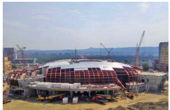
Рис. 4. Ледовая арена на 3500 мест по ул. П. Железняк, г. Красноярск