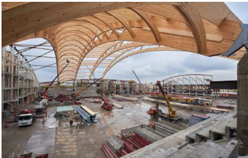
Рис. 8. Стадион «Енисей»

В целях подготовки к празднованию 400-летия города Енисейска министерство курирует реконструкцию домов культурно-исторического значения. В 2017 году завершены работы на 7 объектах, и они уже введены в эксплуатацию, на 6 объектах продолжаются ремонтно-реставрационные работы, а по 3 объектам завершена разработка научно-проектной документации. Всего планируется отреставрировать 22 объекта культурно-исторического значения.