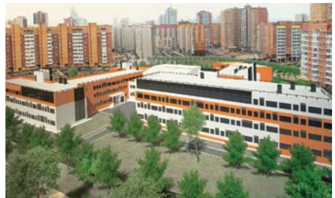
Рис. 2. Школа на 1200 мест в мкр. «Иннокентьевский», г. Красноярск

Помимо уже обозначенных приоритетных направлений, Министерство строительства и жилищно-коммунального хозяйства Красноярского края системно проводит информационно-разъяснительную работу с населением, методологическую с муниципальными образованиями, активно