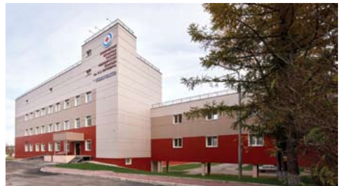
Рис. 3. Красноярская межрайонная клиническая БСМП им. Н.С. Карповича