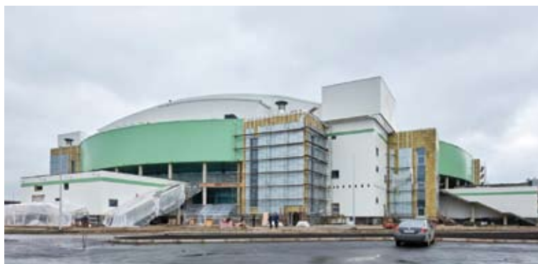
Рис. 7. Спортивно-зрелищный комплекс «Платинум Арена Красноярск»