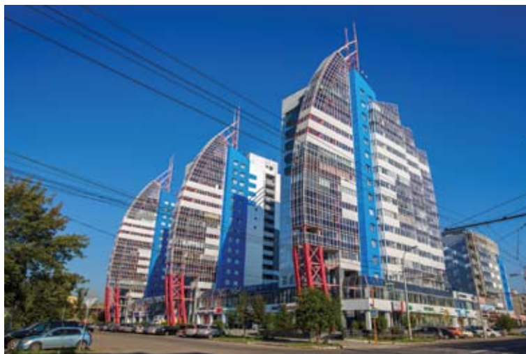
Рис. 1. ЖК «Фрегат НЕО», г. Красноярск

Проделана большая работа, и к 1 января 2019 г. будут разработаны новые механизмы расселения граждан из ветхого жилья для улучшения жилищных условий еще почти 19 тыс. граждан, которые на сегодняшний день проживают в подлежащих сносу домах общей площадью 319,7 тыс. кв. м.