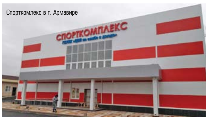
Спорткомплекс в г. Армавире

ках подпрограммы «Обеспечение жильем молодых семей» федеральной целевой программы «Жилище»;