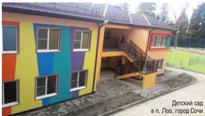
Детский сад в п. Лоо, город Сочи