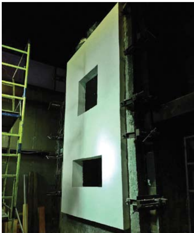
Рис. 1. Теплоизоляционная система с тонким штукатурным слоем ПЕНОПЛЭКС® Фасад до испытаний

Никому и в голову не приходит говорить о пожарной безопасности бензина, находящегося в баке, в отрыве от всей конструкции автомобиля или рассуждать о запрете автомобильных заправок, так как в топливных танках находится огнеопасный бензин. Но некоторые «огнеборцы» постоянно пытаются смешать два понятия: класс горючести строительного материала, то есть его склонность к горению, и показатели огнестойкости и пожарной опасности конструкций.