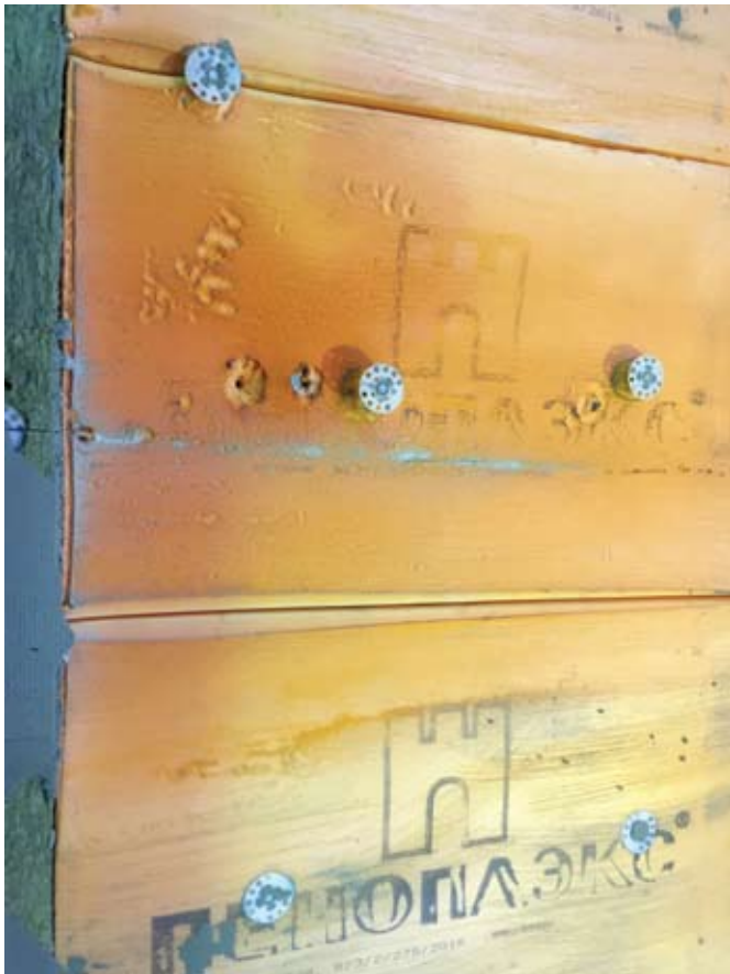
Рис. 3. Теплоизоляция ПЕНОПЛЭКС® после испытаний

вания» и ГОСТ 30247.1-94 «Конструкции строительные. Методы испытаний на огнестойкость. Несущие и ограждающие конструкции». Их сущность сводится к тому, что на образце конструкции, выполненном в натуральную величину, имитируется возникновение пожара изнутри здания и его развитие через оконный проем. При этом замеряется время от начала испытания до появления одного из признаков, характеризующих наступление предела огнестойкости СК.